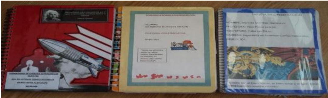
FIGURA N°1 MODELO DE BITÁCORA

estrategia ideada para contribuir a la formación integral (académica, personal y profesional) de niños, niñas y jóvenes de nuestra comunidad educativa.